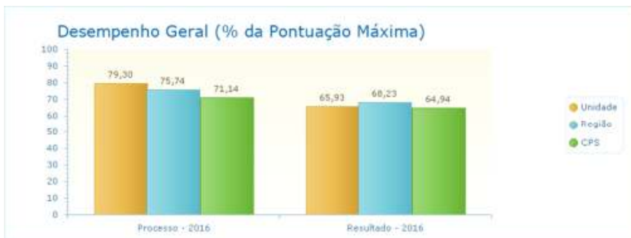
Figura 1 – Desempenho geral

A figura 1 apresenta o desempenho geral da unidade Fatec de Presidente Prudente em relação as demais unidades da região 8 e em relação à todas unidades do Centro Paulista Souza. A figura possui dois indicadores, o indicador processo representa o planejamento da unidade e o indicador resultado representa os resultados obtidos. Observa-se que a unidade de Presidente Prudente se destaca no indicador processo com 79,30% de aprovação e praticamente se iguala no indicador resultado com 65,93%.